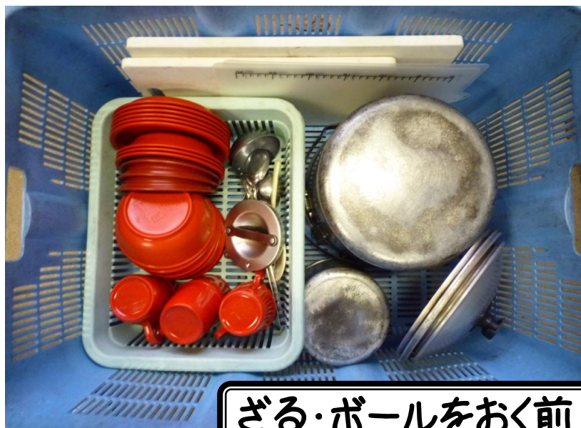
ざる・ボールをおく前