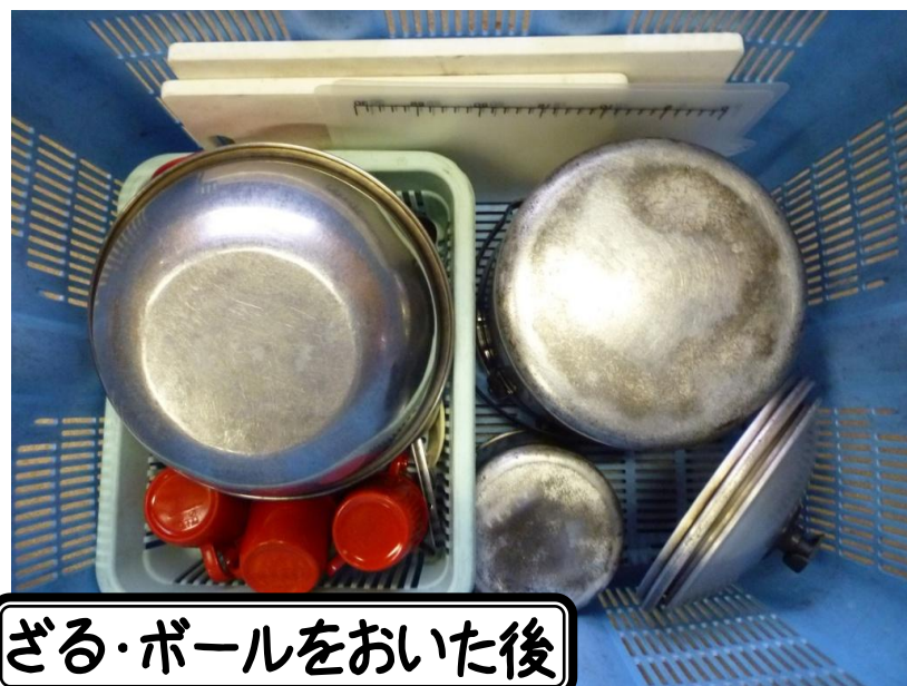
ざる・ボールをおいた後