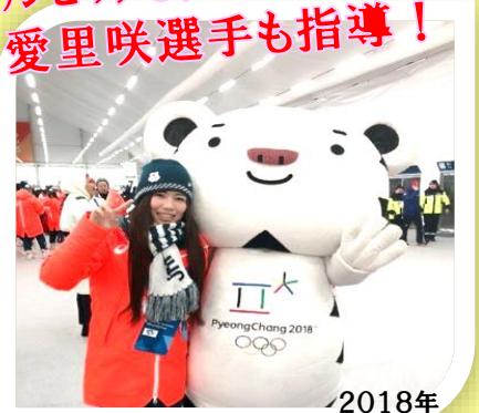
2018年 ピョンチャン五輪大会

【対象】 小学3年生から中学3年生まで 40名 ※スキー経験の有無は問いません。