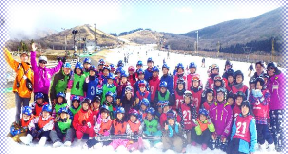
(九重森林公園スキー場)