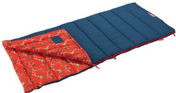
コージーⅡ/C5オレンジ