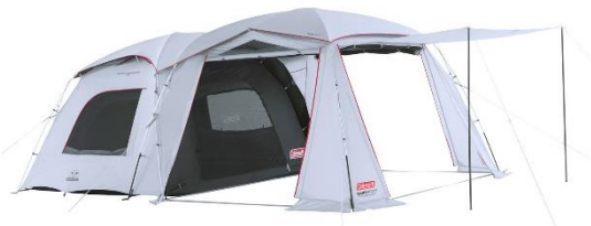
タフスクリーン2ルームハウス/MDX+