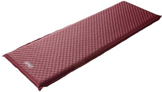
キャンパーインフレーターマット/シングルⅢ