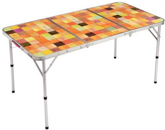
ナチュラルモザイクリビングテーブル/140プラス