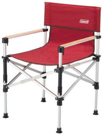
ツーウェイキャプテンチェア (レッド)