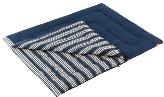
アドベンチャークッションバッグ/C5