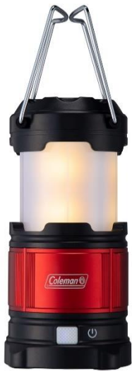
ラギッドパッカウェイランタン (テント内用)