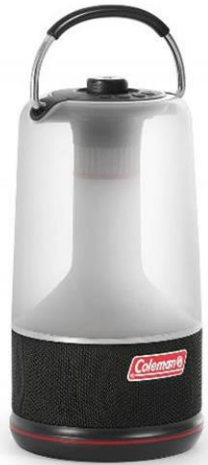
360° サウンド&ライト (テーブル用)