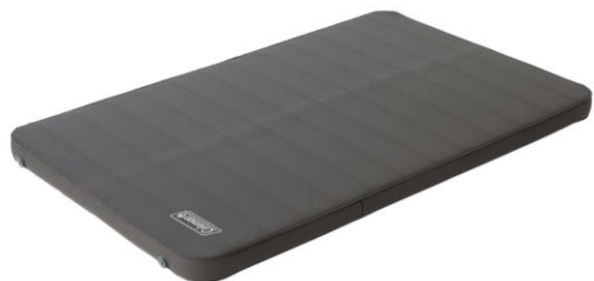
キャンパーインフレーターマットハイピーク ダブル