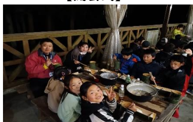
【野外炊飯(豚汁定食)】