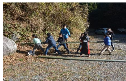
【竹シェルターづくりに挑戦!】