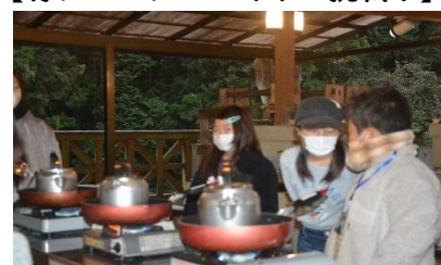
【野外炊飯(ホットサンド)】