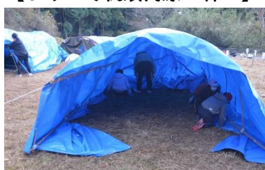
【竹シェルター宿泊】