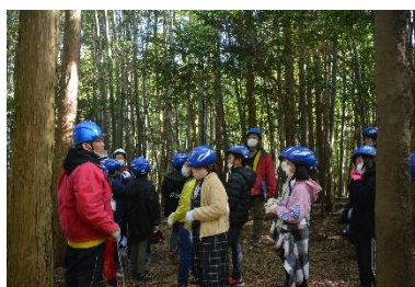
【ようこそ夜須高原の森へ】